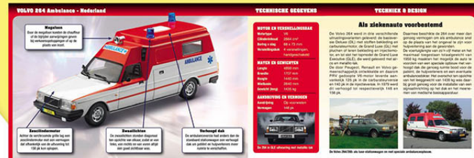
Afm.: 35 x 23,5 cm

Bij uw exclusieve model ontvangt u een 6 pagina's tellende beschrijving in kleur waarin u alles vindt over de geschiedenis en de ontwikkeling van de Volvo-ambulances, met talrijke interessante details over de Zweedse bouwers die de Volvo 264-berlines ombouwden tot rijdende intensive cares. De ideale aanvulling op uw schaalmodel!